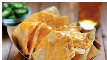
Nachos 9.00 Nachos mit Käse überbacken