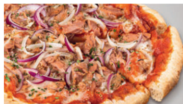
Tonno 15.50 Steinofenpizza mit würziger Tomatensauce, ausgewogenem Thunfisch-Zwiebel-Belag und feinem Mozzarella Käse. Ø 29 cm