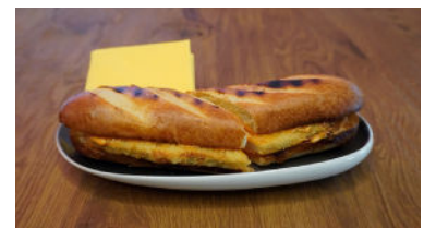
Classic Poulet-Schnitzel 10.00 (Fleischherkunft: Brasilien) Wähle deine Sauce Tartare, Cocktail oder Barbecue Hot

Alle Preise in CHF inklusive Mehrwertsteuer.