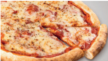
Margherita 13.50 Steinofenpizza mit würziger Tomatensauce feinem Mozzarella Käse. Ø 29 cm