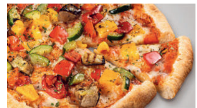
Verdure Grigliate 15.50 Steinofenpizza mit würziger Tomatensauce, ausgewogen belegt mit gegrillter Paprika, Zucchini und Aubergine sowie feinem Mozzarella Käse. Ø 29 cm