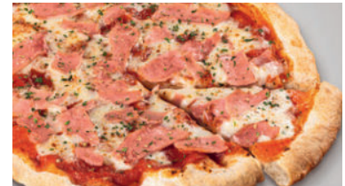
Prosciutto 15.50 Steinofenpizza mit würziger Tomatensauce, ausgewogen belegt mit saftigem Schinken und feinem Mozzarella Käse. Ø 29 cm