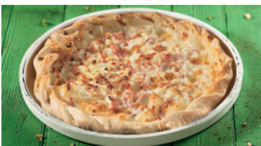
Elsässer Flammkuchen 8.50 Belegt mit Crème fraîche, Zwiebeln und Speck. Ø 24 cm