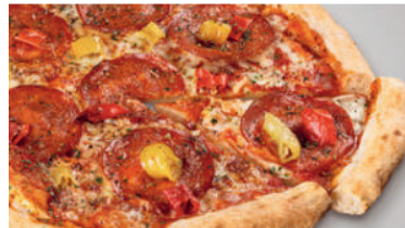
Calabrese Piccante 15.50 Steinofenpizza mit Calabrese-Salami, roten und grünen Peperoni sowie feinem Mozzarella Käse auf würziger Tomatensauce. Ø 29 cm