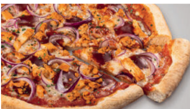
BBQ Pollo 15.50 Steinofenpizza, belegt mit marinierter Hähnchenbrust, pikanter BBQ-Sauce, roten Zwiebeln und feinem Mozzarella Käse auf würziger Tomatensauce. Ø 29 cm